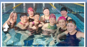
大人スイミングスクール