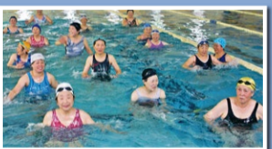
水中ウォーキング

プールの水深は1mで安心! まずはプールで歩きましょう。水中ではからだ軽いので陸上よりも安全に運動ができます。関節も筋肉も動きを取り戻し、血流もよくなります。運動不足・腰痛・肩こり解消に! 初めての方大歓迎! みんなで一緒に歩きましょう。